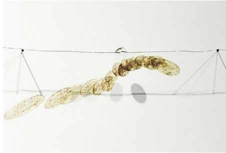
田口友里衣 Yurie Taguchi